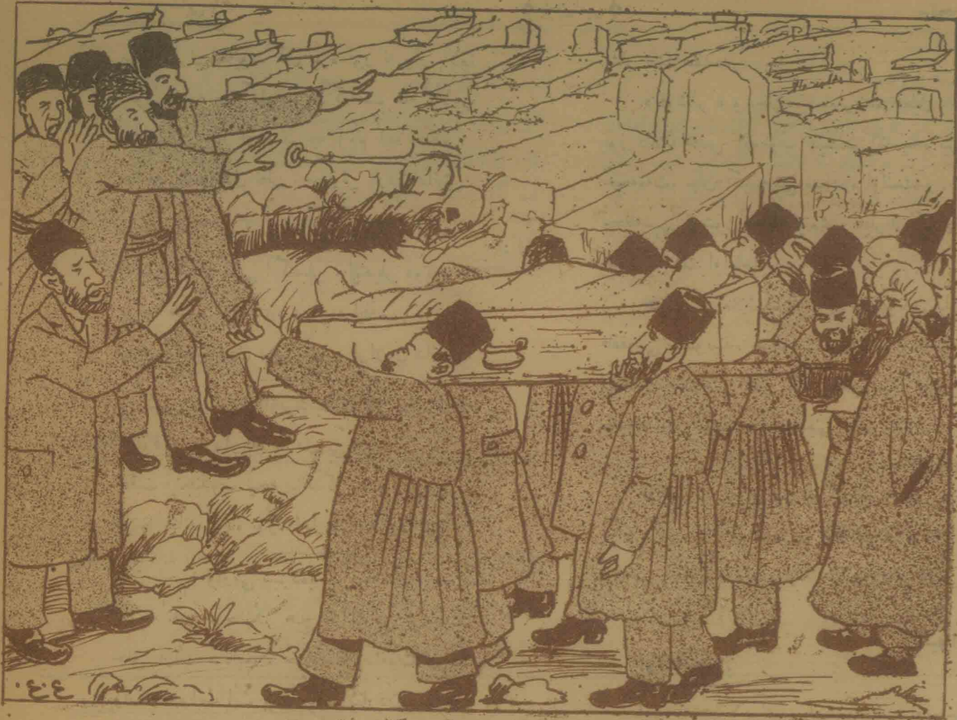
شخیلر - یوق! یوق! برزاده اون ایکی منادن آشاغه قبر اولان . تولی صاحبلی - بش دفعه ساند یقنر قبری بینه آلی منانه دیرمه پورسکن .