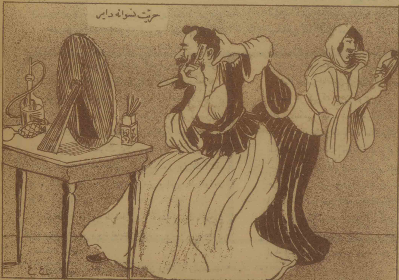
حزیت نسوانه دایر - قرق ایلدن بری حزیت نسوان دیبه باغزان آرتیسلرک یئشید بریک آرتیسکا انجق پشمش یاشنده بین کابلا جعفر اولایله ره م .