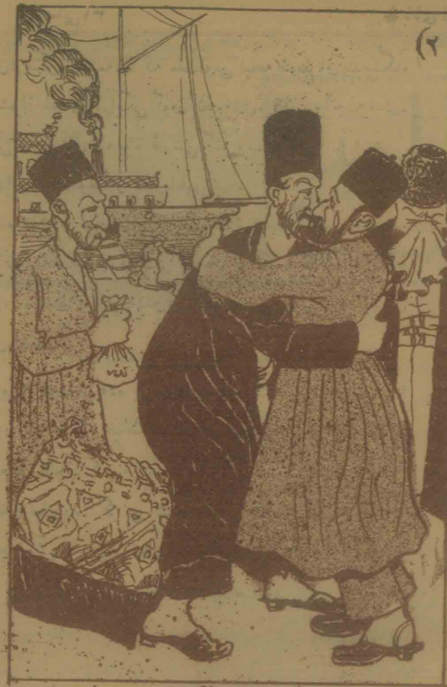
باکوره کی مؤمنلرک کو مک لیگی ایله جهود خراسانه گیدیر .