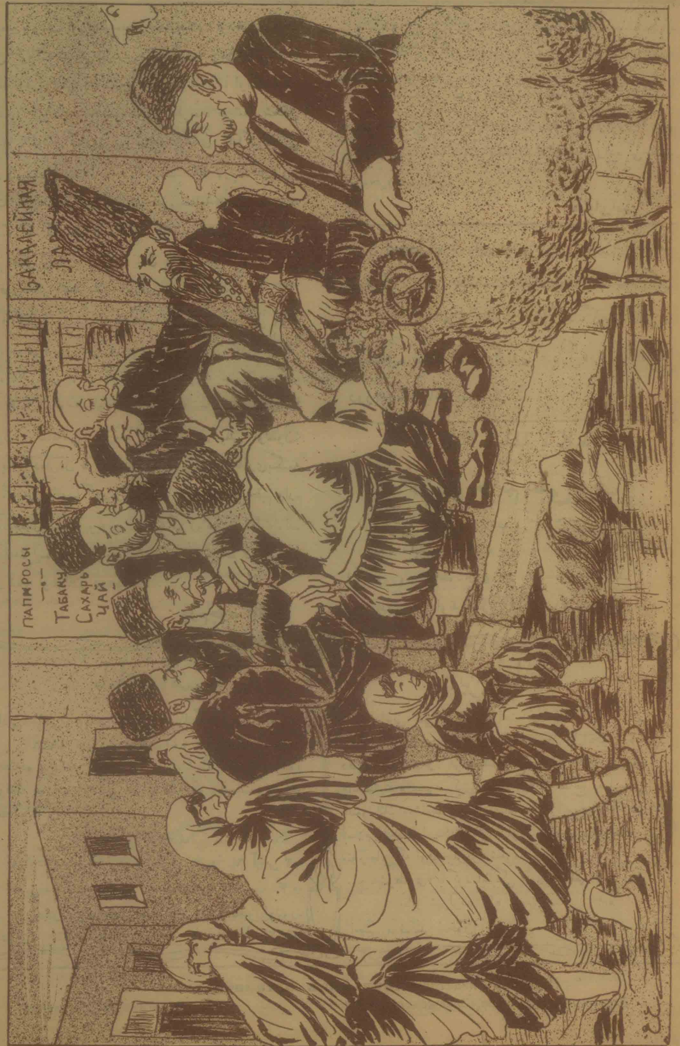
حاجیلردن - قاسم بکک زماننده «ایت» اوتاران دمیسه قایا ایله ناخیرچی خاص پولاد قویج دوگیشدریزیر: بن اووقف اوشاق ایدیم: بیر و انقسا ایدی که گل گور...