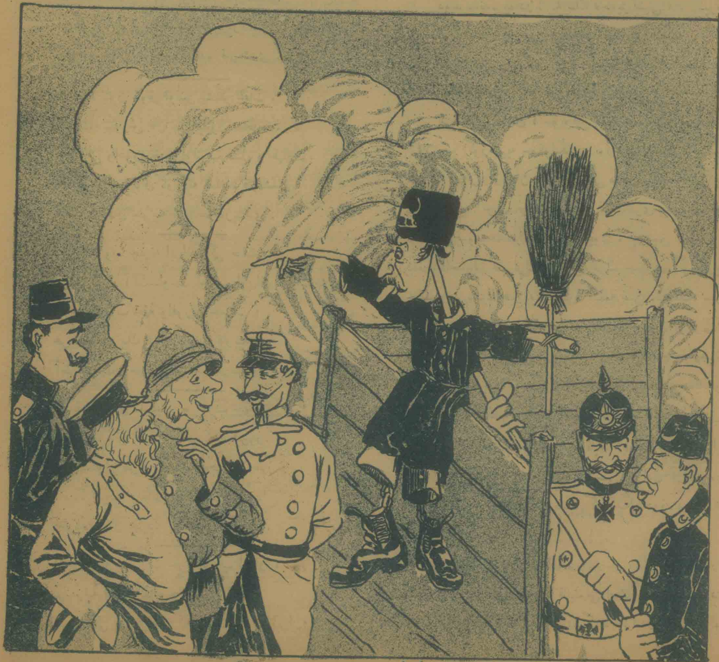
ایرانك ایندیکی وضعی

○ باکو ده نك نسخہ سی (۷) قیك باشقه برلده (A) قیكده . 7-ه 7-ه