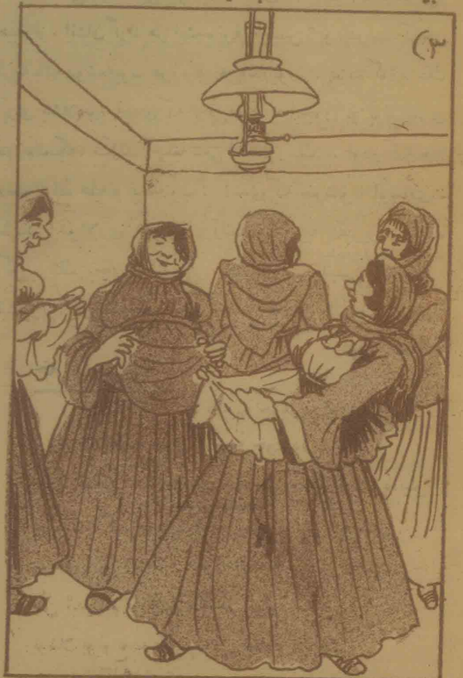
مؤمنلرک آروادلاری :- بزم بوتازه مشهدی جهوده اولسه گوبه گت یازمقده جوق اوستادیر .