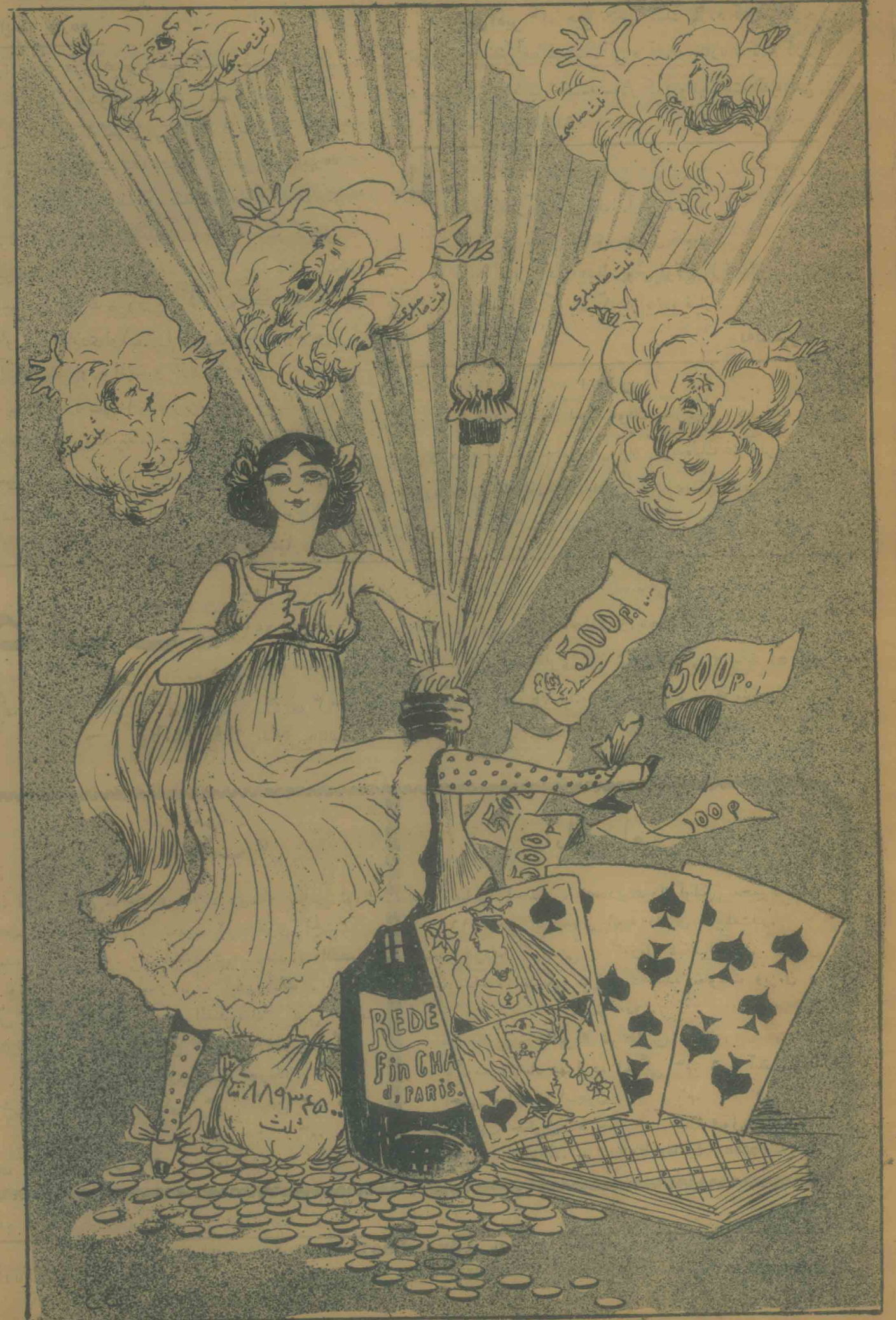
— ساغقلده ملتنه کورمک ائمه یین مرخومک تللی ایچق پویله بیرلر ده صرف اولنار.