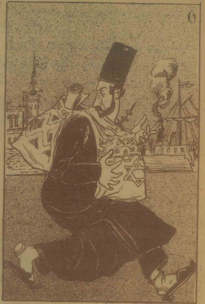
عم اوغلی شموئیل منی گورمه سون که جهود اولما عیم بیلنه ر، مسلمانلار بکا اینا غماز!