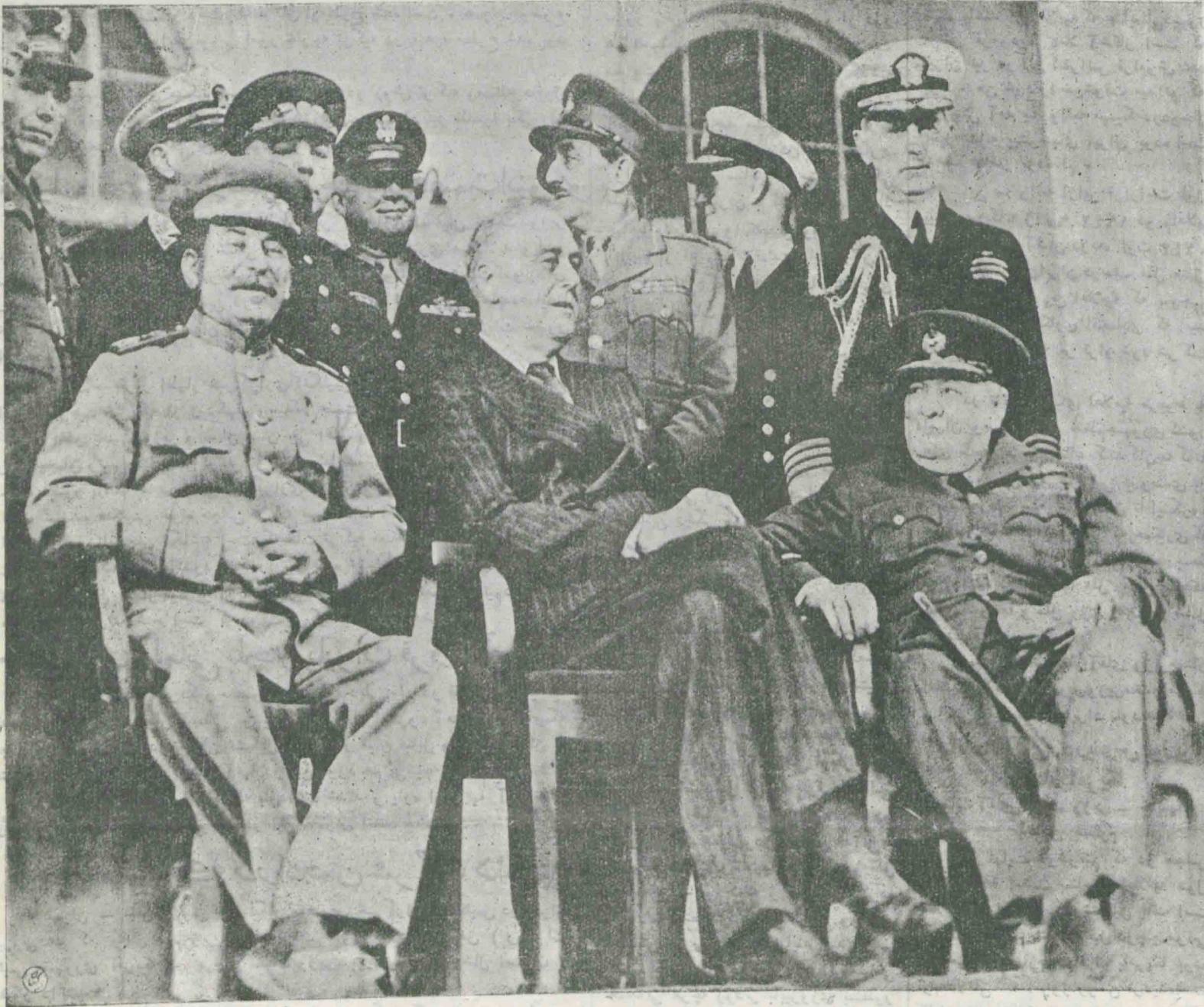
مارشال استالین - روزولت رئیس جمهور آمریکا - و چرچیل نخست وزیر بریتانیا کبیر در موقع فراغت از کنفرانس سه جانبه متفق در تهران-ایران ایستاده از چپ بر است عبارتند از فیلدمارشال سر جان دیل - ژنرال چرچس - مارشال رئیس ستاد ارتش آمریکا - دریا سالار ارشد ج. کینگ رئیس عملیات نیروی دریایی آمریکا - مارشال کلنتی وروسیاف - ژنرال هانری - ارنولد رئیس نیروهای هوایی ارتش آمریکا - ژنرال سران بروک رئیس ستاد ارتش امپراطوری - دریا سالار سراندریو کینیکهام ارد اول درباری - و دریا سالار ویلیام د. لیبی رئیس ستاد روزولت