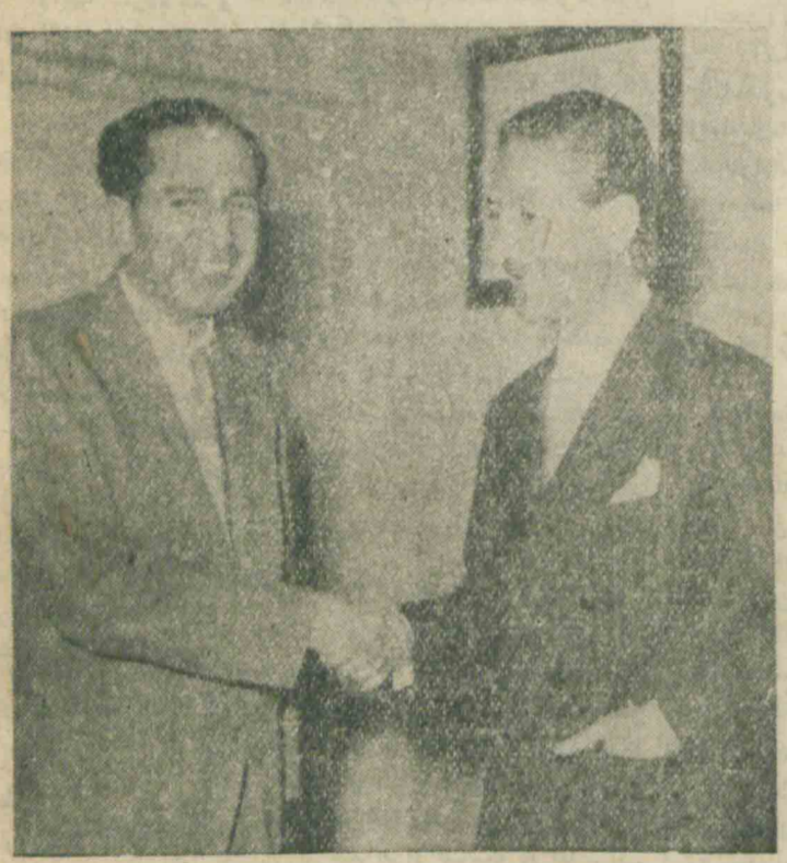
انظام و نواب دست یکدیگر را میشارند شرح در صفحه ۴

ابراز احساسات و از دحام شدید دیروز مردم که با استقبال حضرت آیت‌الله کاشانی شتافته بودند موجب شد که ورود ایشان از فرودگاه بمنزل، بیش از دو ساعت و نیم بطول انجامد عصر دیروز فرودگاه مهر آباد آیت‌الله کاشانی شتافته بودند موج از جمعیت کثیری که با استقبال حضرت میزد. بقیه در صفحه ۲