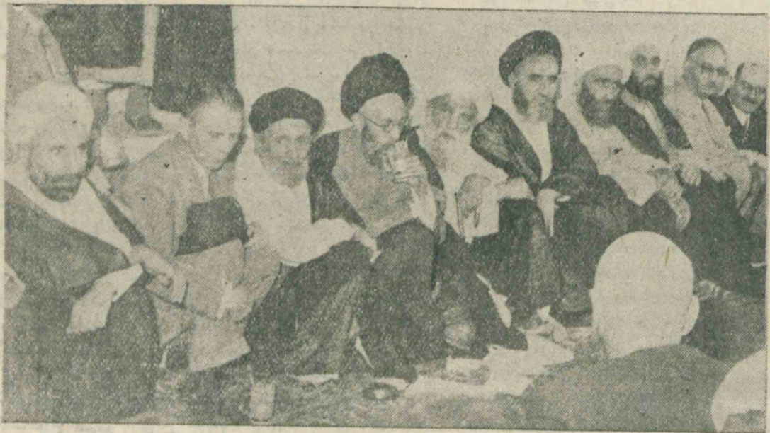
آقای علاء و عده‌ای از آقایان علمای اعلام در ملاقات امروز با حضرت آیت‌الله کاشانی

حضرت آیت‌الله فرمودند: برای تشکیل جبهه واحدی از عموم مسلمین جهان مذاکرات اساسی با سران دولت اسلامی مردم ملل اسلامی نباید هیچگونه مداخله و شرکعی در اتحادیه‌هایی نظیر سازمان دفاعی خاور میانه و اتحادیه اتلانتیک شمالی داشته باشند من با پیشنهاد مشترک امریکا و انگلیس بگلی مخالفم انگلیس و امریکا حق ندارند در کار ایران و شرکت سابق دخالت کنند