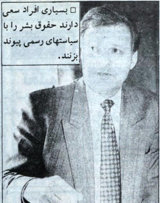
بسیاری افراد سعی دارند حقوق بشر را با سیاستهای رسمی پیوند بزنند.

ما صاحب بازارهای تریف شده اقتصادی نیستیم. ما در حال مذاکره با قزاقستان برای فروش نفت به قزاقستان هستیم در همان حال حوزه‌های نفتی خود را به دیگران می‌فروشیم. شما نمی‌توانید از طبقه اول به طبقه چهارم ببرید. برنامه اقتصادی اکنون چنین هدفی را بدون تدارک وسایل لازم برای این جهش دنبال می‌کند.